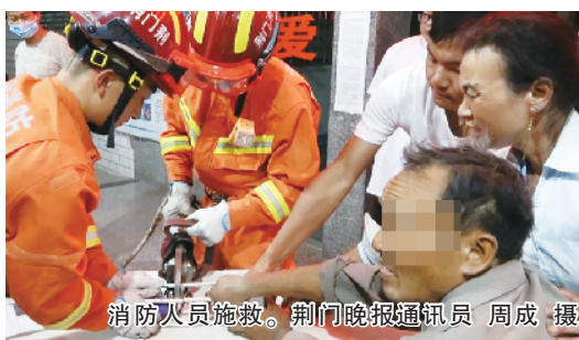
消防人员施救。

20时许, 消防救援人员到达平安医院。经了解, 老农在维修自家碎谷机时, 由于操作不当, 右手整个手掌被碎谷机传送轴卷中, 右手三根手指被传送轴卷破并卡在了钢制圆筒内, 中指已骨折, 血流不止。了解情况后, 消防救援人员迅速使用液压剪切钳对钢制圆筒的三根支柱进行剪切, 增加救援空间, 舒缓老农手部的剧烈疼痛感。剪切完成