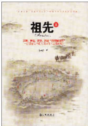
《祖先》 安森焱 著 九州出版社 45.00元

本书有对历史人物的评价，有对历史事实的再认识，有目录版本学的读书方法，反映了孙犁的阅读趣味和历史观，有助于我们更好地理解孙犁其人其文。