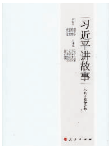
《习近平讲故事》 人民日报评论部 人民出版社 48.00元

习近平总书记的讲话、文章中，常常用讲故事的方式传达深意、感染他人，把深刻的思想、抽象的理论转化为鲜活的故事、生动的例子，具有直抵人心的力量。